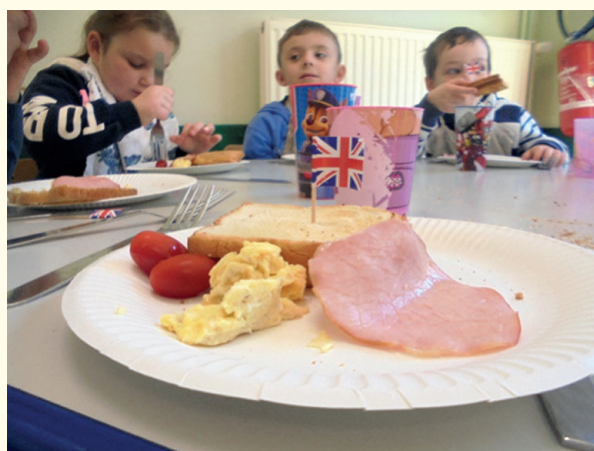
A l'année prochaine pour d'autres projets !...