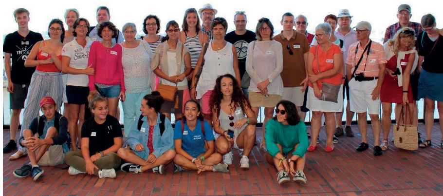
Une de nos dernières visites à HAMBourg

BEL ETE A TOUS et rendez-vous le 6 juillet pour la réunion à 20 h30 puis le 30 juillet à 15h00 pour le départ.